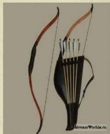
Лук. Колчан со стрелами